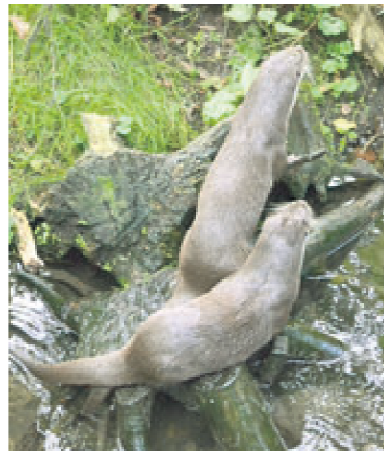
Ein neugieriges Otter-Pärchen auf Erkundungsausflug.

Das Hankensbütteler Vorzeigeprojekt hat sich weit über die Region hinaus einen Namen in Sachen Umweltschutz gemacht. So wurde unter anderem das Regionale Umweltzentrum (RUZ) ins Leben gerufen, das als außerschulischer Lernort mit dem Schwerpunkt Gewässerpädagogik gilt.