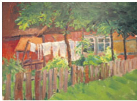
Die trocknende Wäsche auf der Leine malte Hermine um 1896/97.

Malen wie Hermine können Teilnehmer eines Workshops mit Barbara Jorns am 27. und 28. August von 11 bis 17 Uhr im Overbeck-Museum. Als Vorlage dienen Bilder