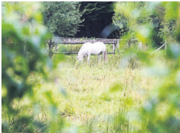
Der Bremer Norden verfügt zwar nicht gerade über großzügige Grünflächen. Dafür gelten die Wiesen nördlich der Lesum allerdings als besonders artenreich.

Das 192-seitige Werk „Bericht zur Lage der Natur in Bremen“ ist kostenlos erhältlich beim Bremer Senator für Umwelt, Bau, Verkehr und Europa, Ansgaritorstraße 2, im Stadtzentrum.