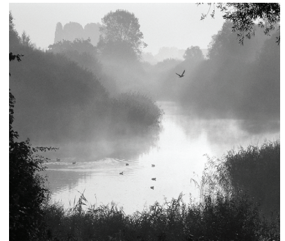
Blick vom Beobachtungsstand am Westufer

Vielleicht begegnen sie auch dem ehrenamtlichen Naturschutzwächter , der dieses Naturschutzgebiet betreut. Dieter Klimpt freut sich darauf, Ihre Fragen zu beantworten und Ihnen die eine oder andere spannende Geschichte von der Neuen Weser zu erzählen.