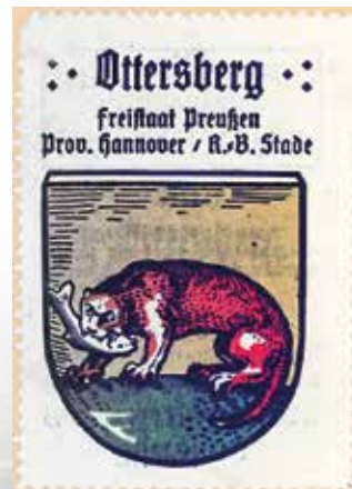
Briefmarke mit einer Fischotterdarstellung auf dem Wappen des Fleckens Ottersberg