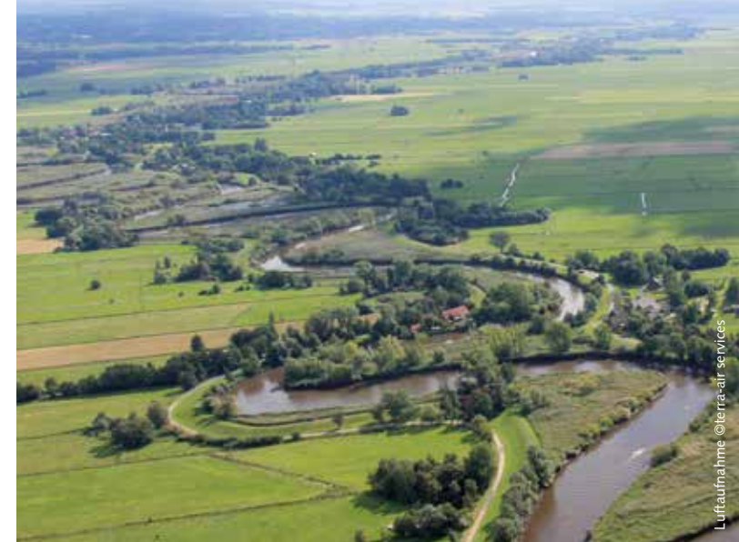
Luftaufnahme ©bera auf se.ries

Zur Abwehr von Sturmfluten, die auf Grund des Weserausbaus mit ihren Auswirkungen immer spürbarer bis nach Bremen reichen, wurde in den 1970er Jahren an der Lesummündung ein Sperwerk errichtet. Im gleichen Zeitraum verhinderte das Engagement von Anliegern und Naturschützern Planungen zur Flussbegradigung. Die Ausweisung als Schutzgebiet bietet trotz der genannten Einschränkungen die Grundlage für eine naturnahe Entwicklung.