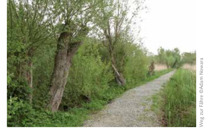
Weg zur Fähre