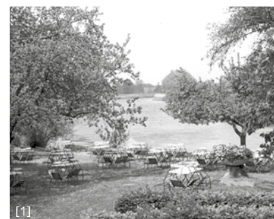
1 Dammsiel 1980; 2 Wümmeblick; 3 Niederblockland

Naturnah, in weiten Schleifen, mäandriert der Unterlauf der Wümme am Nordrand des Bremer Blocklandes. Eine Rarität in Norddeutschland! Vierorts wurden Flüsse im letzten Jahrhundert begradigt und verloren somit ihre Eigenart und ihren Reichtum an Tieren und Pflanzen. Nicht so an der Unteren Wümme: zahlreiche Wanderfische verleihen ihr den Rang eines europäischen Schutzgebietes. Der scheue Fischotter ist hier wieder genauso heimisch wie Röhrichtbrüter und Graureiher.