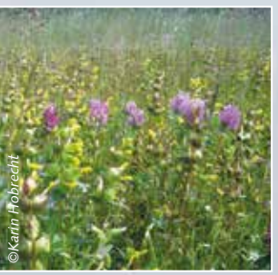
Wiese mit Großem Klappertopf