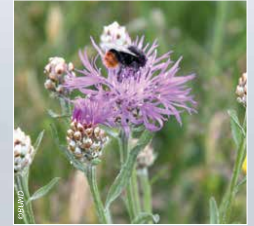
Wiesen-Flockenblume mit Steinhummel