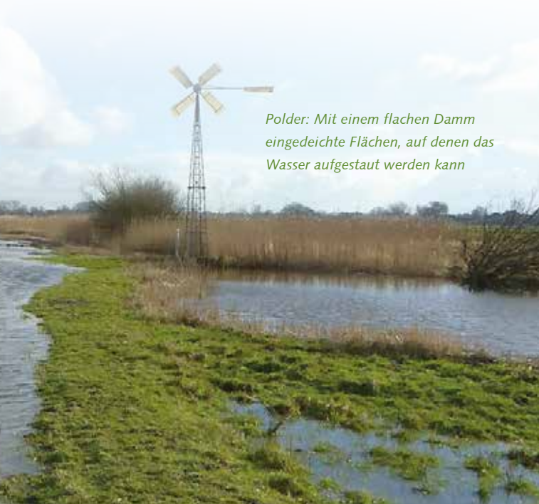
Polder: Mit einem flachen Damm eingedeichte Flächen, auf denen das Wasser aufgestaut werden kann