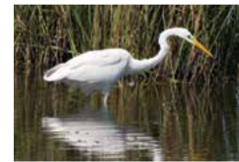
Weißstorch und Silberreiher