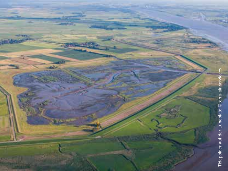
Tidepolder auf der Luneplate